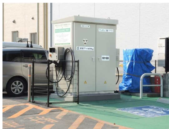
向日市役所に設置された「EnePOND® EV Charger」

CONNEX SYSTEMS は、EV を核とするサーキュラー・エコミーの構築とカーボン・ニュートラルの実現に寄与するべく、本実証をファーストステップとして、EnePOND®を用いた様々なエネルギー・ソリューションのグローバル展開を推進してまいります。