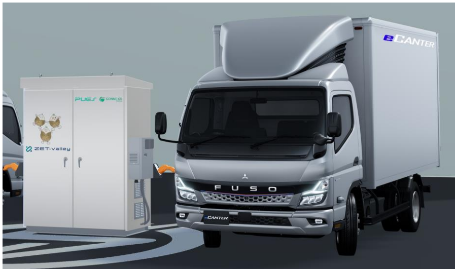
「eCanter」と「EnePOND ® EV Charger」

EV の本格的な普及には、充電設備、特に急速充電器の拡充が不可欠ですが、そのためには送電線の高電圧化等が必要となり、多額のコストと時間がかかります。一方、一旦 ESS に蓄電した電力を急速充電器に供給する形を取れば、そのようなインフラ投資は不要となりますが、その場合も ESS の導入コストが問題です。このような課題がある中、CONNEXX SYSTEMS は、独自開発の BIND Battery ® 技術（日米欧特許）により、使用済みバッテリーにほとんど手を加えることなくリユースすることで、極めてリーズナブルに導入可能な定置型蓄電システム「EnePOND ® 」の開発を進めてまいりました。